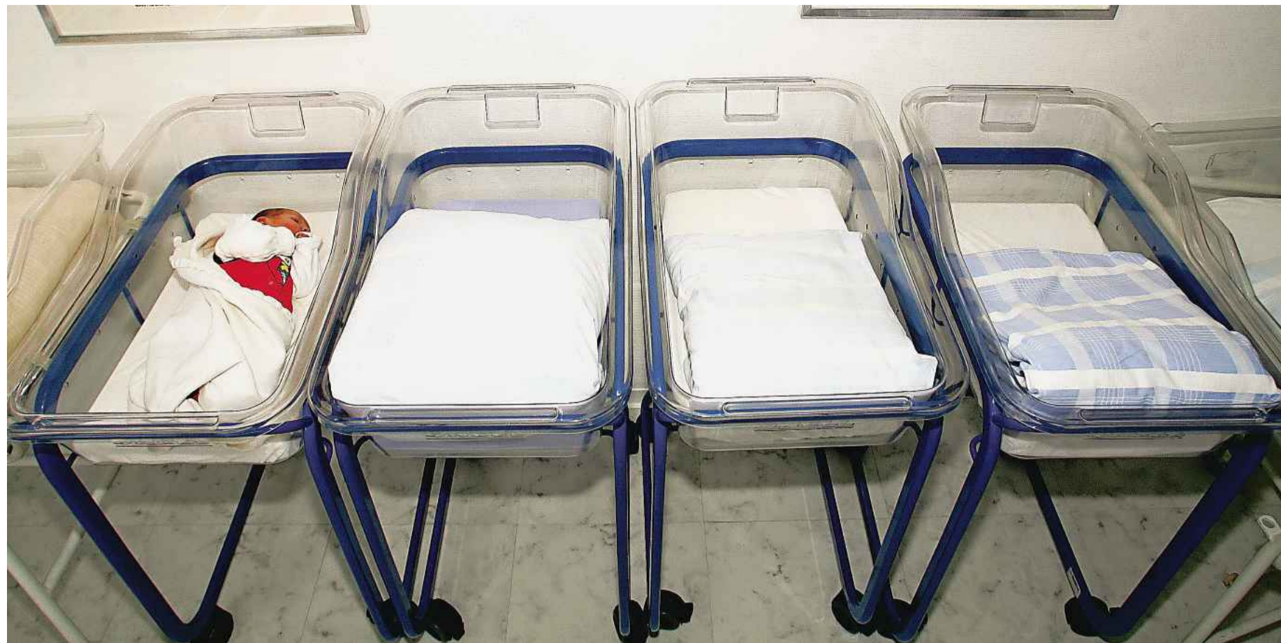
Fehlt da nicht was? Weil wie überall in Deutschland auch am Bayerischen Untermain immer weniger Kinder geboren werden, soll ein regionales Bündnis die Stadt und den Kreis Aschaffenburg sowie den Kreis Miltenberg familien- und kinderfreundlicher machen. Unsere Zeitung fragt deshalb ihre Leser: Was braucht man dazu? Archivfoto aus der Aschaffener Frauenklinik.